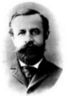
Edward Bellamy (1850-1897). Deze zoon van een predikant uit de Amerikaanse staat Massachusetts studeerde rechten, maar gaf het beroep van advocaat snel op om schrijver en journalist te worden.