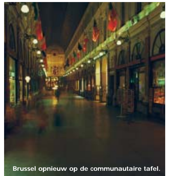
Brussel opnieuw op de communautaire tafel.