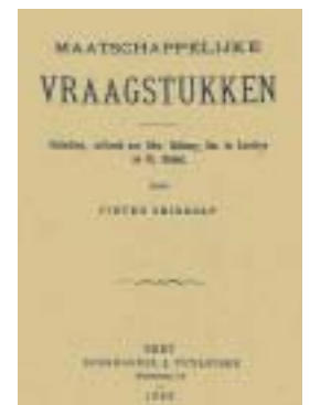
Bellamy's utopie was veeleer een communistische dan een liberale maatschappij. Daarom liet Geiregat op dit betoog een repliek volgen van Emile de Laveleye.