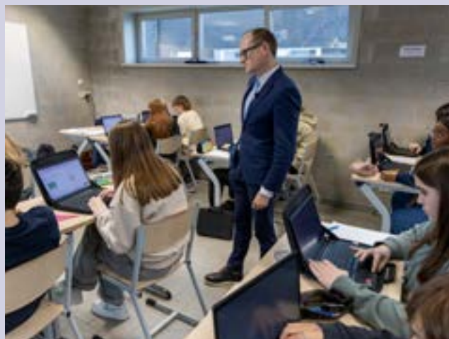
In geen enkele regio gaat de onderwijskwaliteit zo snel achteruit als in Vlaanderen.

Het Vlaamse onderwijs is een logge tanker die de jongste decennia in een verkeerde richting is aan het dobberen. Een logge tanker van koers veranderen is niet evident. Niets doen is echter geen optie. Wie jongeren onderwijs ontnemt, ontnemt hun de kans op ontwikkeling, bewustzijn en levensgeluk. Voorwaar een belangrijke stimulans om de logge tanker van koers te doen veranderen. Er is geen tijd te verliezen.