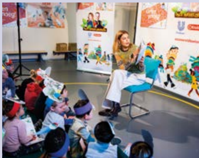
Voer een leerplicht in vanaf drie jaar.