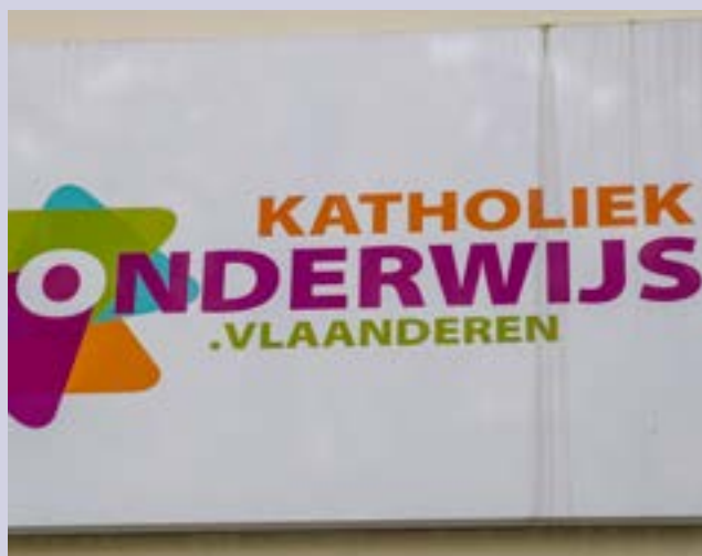
Financier leerlingen en ouders, en niet de onderwijskoepels.