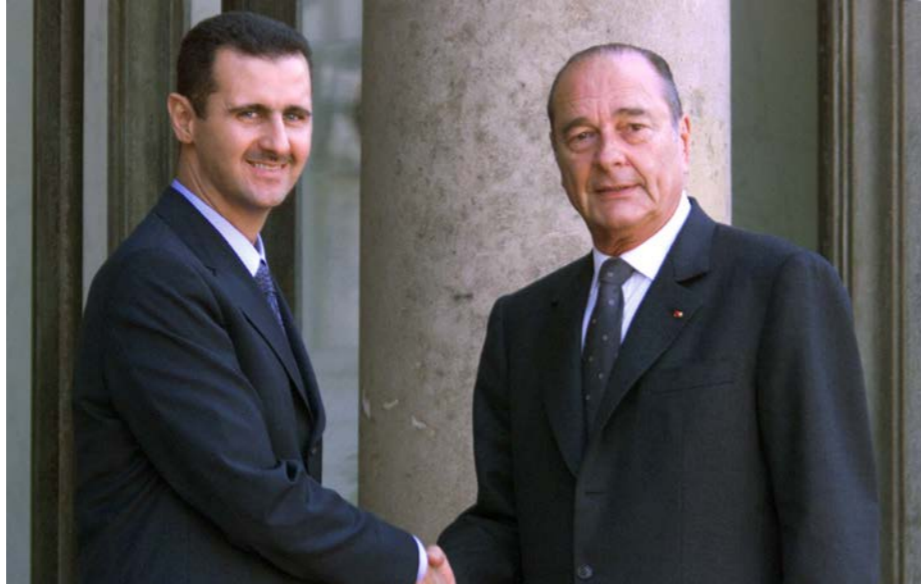
Basjar Assad was ook steeds welkom in het Westen, met de Franse president Chirac in 2001.

Dat lachende derde Turkije is staat buiten kijf. De sjiiitische dreiging is weg. De SNA-militie, die Ankara sponsort, opende meteen aanvallen op het Koerdische bolwerk Marbij en verjoeg duizenden Koerden uit Tal Rilaat. De Democratische Strijdkrachten van Koerdistan (SDS) hebben zich redelijk afzijdig gehouden tijdens de machtsovername, behalve volksgenoten ontzeten uit Aleppo. Maar Erdoğan's doel is natuurlijk het verpletteren van de YPG, de zelfverdedigingseenheid die – net zoals het los regionaal verzet bij de Jordaanse grens - steun krijgt van de VS. De