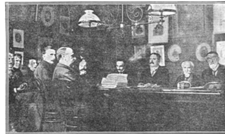
Het bureau van het partijcongres in juli 1919.

volgens een goedgekeurde resolutie op het partijcongres van 1919 vooral belang aan een stapsgewijs proces van politieke educatie van vrouwen en plaatste de burgerlijke ontvoogding van vrouwen op de eerste plaats. Vanuit deze redenering bleef de partij gedurende het hele interbellum afwijzend staan tegenover het verder toekennen van politieke rechten aan vrouwen (voor de provincieraadsverkiezingen en de wetgevende verkiezingen), tot ongenoegen van de liberale vrouwenbeweging die zich meer en meer organiseerde.