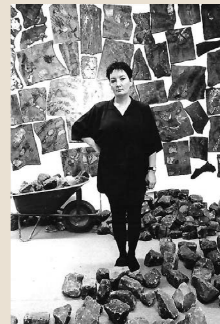
Veerle Dupont © www.veerle-dupont.be

Eind jaren zeventig – begin jaren tachtig verlaat de textielkunstenaar de wand en concentreert zich op beelden, objecten, collages, assemblages en installaties. Ze is inmiddels naar Antwerpen verhuisd waar ze zich laat inspireren door ordinaire gevonden voorwerpen (objets trouvés) die ze assembleert tot kunstobjecten. Veerle Dupont laakt de