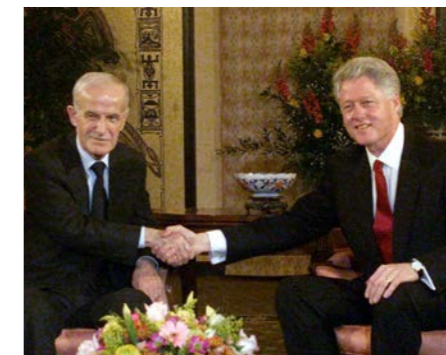
Hafez al-Assad, de vader van de nu naar Moskou gevluchte Basjar, in betere tijden met de Amerikaanse president Bill Clinton in 2000.

Dat gedwongen isolement riep al snel middeleeuwse beelden op: een burgeroorlog, de opmars van Al Kaida, de stichting van een kalifaat in Syrië en Irak, de rivaliteit met Turkije, zetten de verdeeldheid van het land dik in de verf. Zoals de vroegere baronieën, lag ook Syrië als een taart in stukken gesneden. De Koerden hadden hun eigen veiligheidszone uitgebouwd in het noordoosten. Elders in het