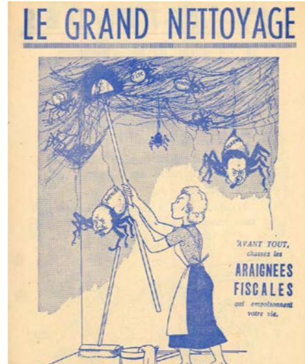
Dit liberale kiespamflet voor de eerste wetgevende verkiezingen waar vrouwen konden stemmen (1949) beeldde de huisvrouw op creatieve wijze uit als burger die kon stemmen tegen het fiscale beleid van de christendemocraat Gaston Eyskens.

niet door de beugel dat vrouwelijke verwanten van collaborateurs wiens politieke rechten waren ontnomen zouden stemmen in de eerste naoorlogse verkiezingen. De tegenreactie vanuit de CVP was ongemeen heftig. De partij maakte geen deel uit van de regering en hoopte om via vrouwenstemrecht aan een parlementaire meerderheid te raken om Leopold III weer op de troon te krijgen. Door het verdragingsmanoeuvre van de regering konden vrouwen bij de verkiezingen van februari 1946 nog steeds niet stemmen.