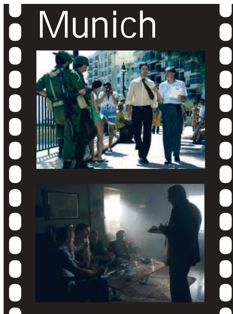
"Spielbergs "Munich" wordt nu al tot de 10 beste films van 2006 gerekend"

De film oordeelt niet over goed en slecht. Geweld lokt geweld uit en daarbij doen de Joden niet onder voor de Arabieren. Geweld verandert mensen, zo ook Avner. Zoals zoveel jonge mensen nog steeds doen vandaag, komt Avner op voor zijn land, Israël. Maar de druk op zijn persoonlijke leven, zijn vrouw die hun pasgeboren dochtertje alleen opvoedt en die hij tijdens de opdracht nauwelijks ziet, wordt te groot, zeker wanneer blijkt dat ook zij mogelijk gevaar lopen. De spanningen in het Midden-Oosten maken opnieuw een leven kapot en dat is te wijten aan beide kampen. Geen poli-