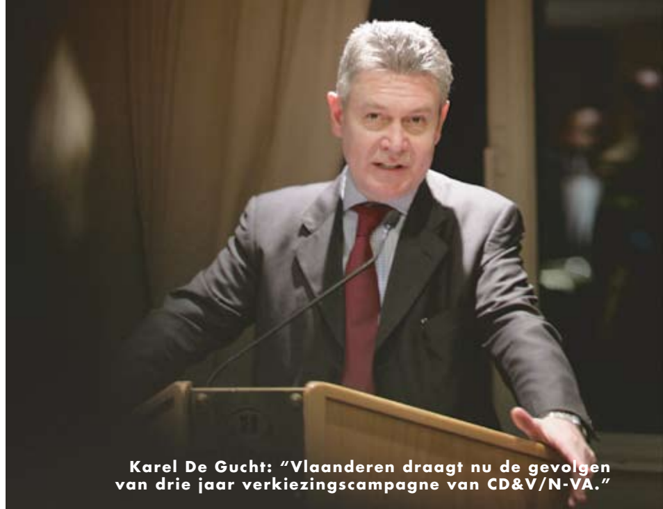
Karel De Gucht: "Vlaanderen draagt nu de gevolgen van drie jaar verkiezingscampagne van CD&V/N-VA."