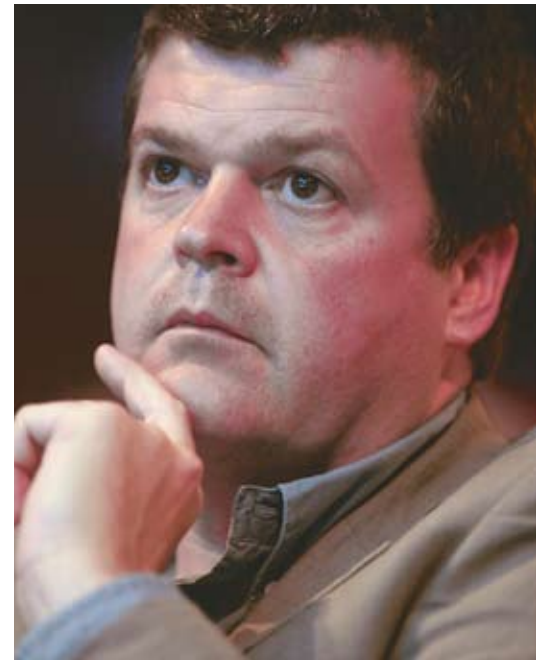
Open Vld-voorzitter Bart Somers: een regering met sterke liberale accenten.

Net na de verkiezingen hebben de media geprobeerd het vel te pakken van Open Vld-voorzitter Bart Somers. Het zou in de gegeven omstandigheden niet slim zijn om zomaar over te gaan tot het opzij schuiven van mensen. Een partij die intern overhoop ligt, is allesbehalve geloofwaardig aan de onderhandelings-tafel en komt tegenover haar partner in een uiterst zwakke situatie terecht. Wel