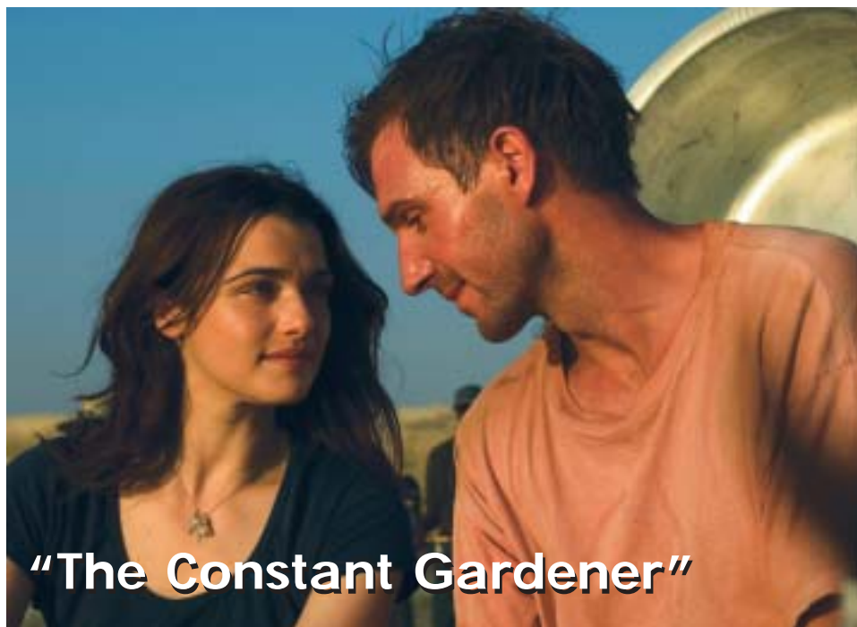
"The Constant Gardener"

Fernando Mereilles leverde in 2002 al een ijzersterke film af met "Cidade de Deus" dat zich afspeelt in de getto's van Brazilië. In "The Constant Gardener" schudt hij de westerling opnieuw wakker. Mereilles neemt ons mee naar het verloren continent, Afrika, wat prachtige natuurbeelden oplevert, maar ons tegelijkertijd confronteert met de eindeloze kloof tussen arm en rijk. Met zijn mix van aanklacht, romantiek en suspense is "The Constant Gardener" een echte aanrader.