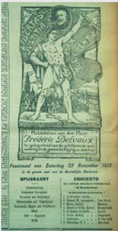
Fragment van de voorpagina van De Nieuwe Gazet van 24 november 1907, met de affiche van de huldiging van Delvaux, de spij斯卡art en het concertprogramma.

uit De Nieuwe Gazet van 25/26 november 1907