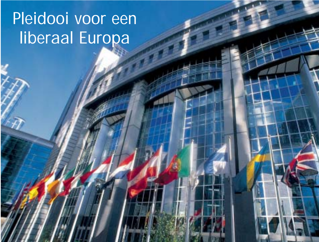
De Europese Unie heeft jaarlijks 13,5 miljoen migranten nodig.

Liberalen moeten niet alleen voorstander zijn van een vrij verkeer van goederen, diensten en kapitaal, maar ook van personen. Zowel om principiële als om demografische redenen dient de migratiestop van de jaren zeventig, opgeheven te worden. Dat schrijft Mathias De Clercq in een opvallend “Pleidooi voor een liberaal Europa”.