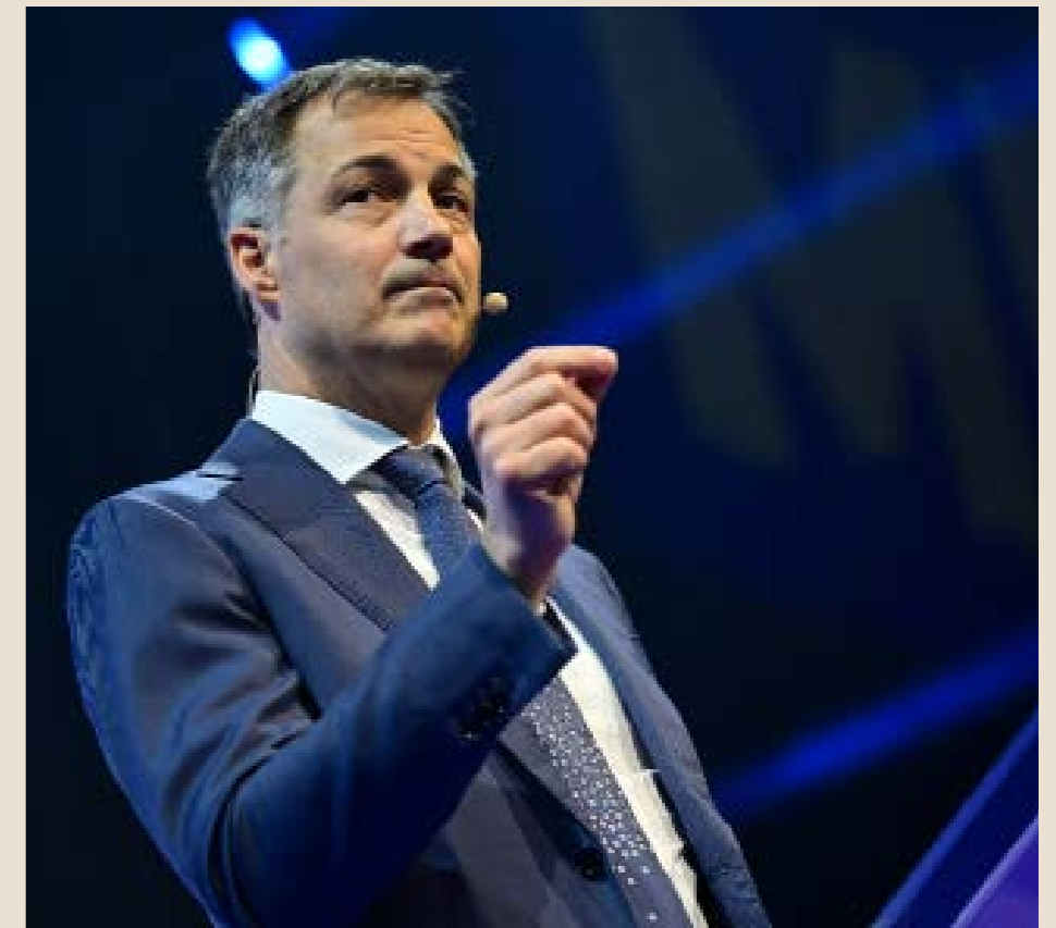
Premier Alexander De Croo: kan hij op zondag 9 juni de meubelen voor Open Vld nog redden?

Op 10 juni 2024 zullen we wakker worden in een nieuwe realiteit. Wat die ook moge zijn, mogen we gezinsdefaitistisch blijven liggen en de politieke situatie van dat moment ons laten verlammen. Met vernieuwende krachten moeten we beginnen bouwen aan de liberale partij van de 21e eeuw, om uitiem een vrijere maatschappij te bewerkstelligen. Een Liberale Partij die op een geloofwaardige manier een toekomstvisie voor kan spiegelen. Die terug hoop kan bieden. Onze vlag moet tussen nu en 2029 weer zegepralen.