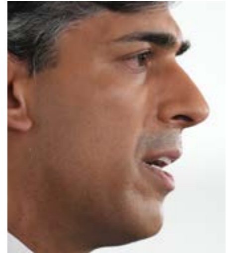
De Britse premier Rishi Sunak, “wiens Engels beter is dan zijn politiek genie”.

Eigenlijk ligt heel Engeland aan het infuus. Maar ze weten het nog niet. Of zoals een oudminister zei: “Sunak isn’t being challenged only because no-one wants to own the failure” (BBC).