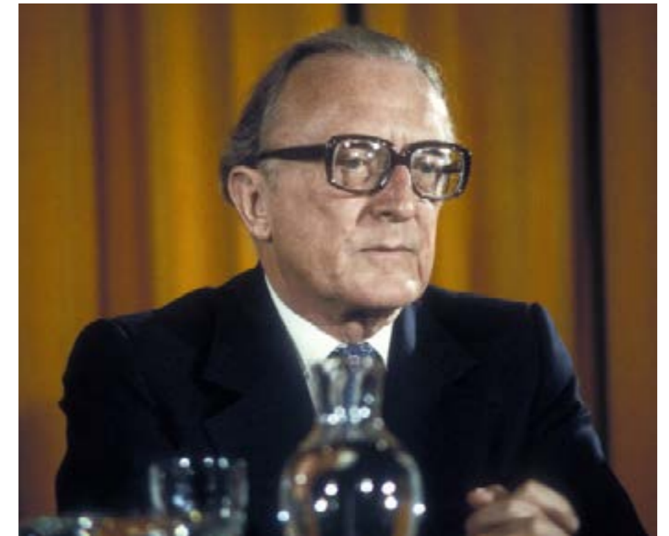
Heimwee naar Lord Peter Carrington (1919-2018).