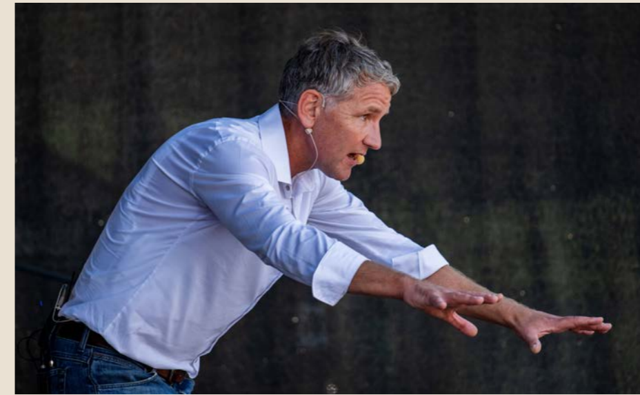
Björn Höcke van Alternative für Deutschland (AfD) won op 1 september de Landtag-verkiezingen in Thüringen met zijn uiterst rechtse partij.

Die geschiedenis, en het duidelijk falen van de beloften die de globalisering, de vrijemarkt-economie, en de Europese Unie hadden gedaan,