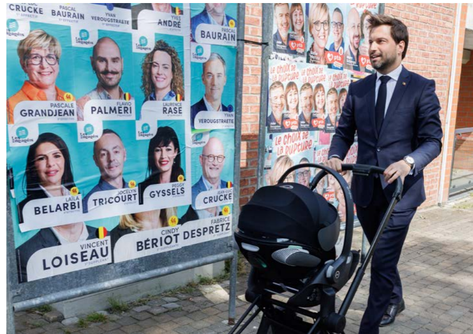
In Wallonië bevestigen MR en Les Engagés de sterke resultaten van 9 juni. Op de foto MR-voorzitter Georges-Louis Bouchez.

De vijf partijen die momenteel onderhandelen over een federale regering (de zogenaamde Arizona coalitie) komen ongeschonden uit de lokale verkiezingen.