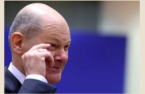
De Duitse Bondskanselier Olaf Scholz nam een U-bocht over migratie, eiste opnieuw grenstoezicht, en stelde vragen bij Schengen.

geven voedsel aan een afwijzingsdrang, zeker sinds de bankencrisis van 2007-2008, en de daarop volgende massale migratie naar de Unie, een gevolg van de aanslepende oorlogen in het Midden-Oosten en Noord-Afrika, en recenter in Oekraïne. Merkels "Wir schaffen das" (2015) heeft hoedanook gefaald, ook als Duitsland nog altijd één derde van alle asielzoekers in de EU opneemt.