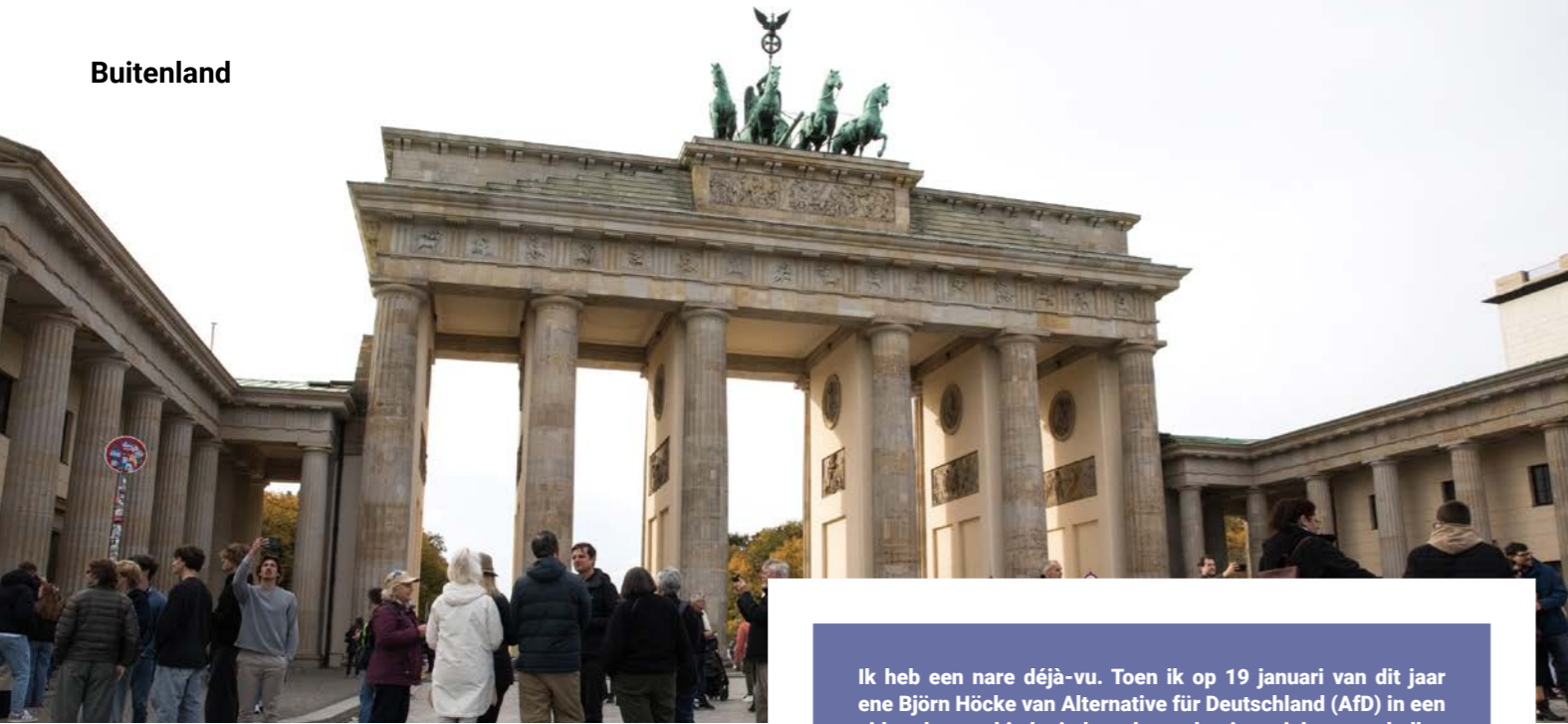
Berlijn: dat er sinds de Wende frustraties zijn ontstaan en zekerheden weggefallen, staat buiten kijf.